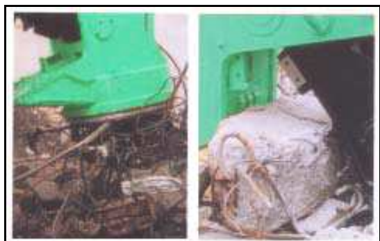
Aimant puissant !

Possibilité d'opération simultanée de pulvérisation et de magnétisation